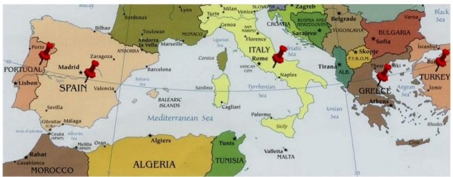
Best viewed in 1024x768